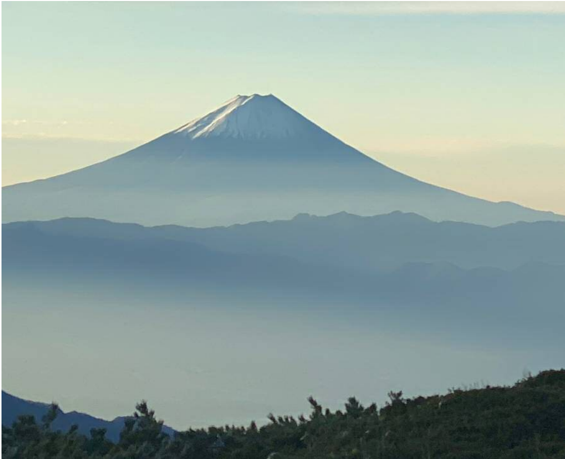
『富士山』 撮影場所：甲武信ヶ岳